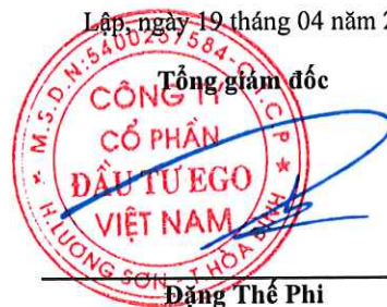
Dặng Thế Phi